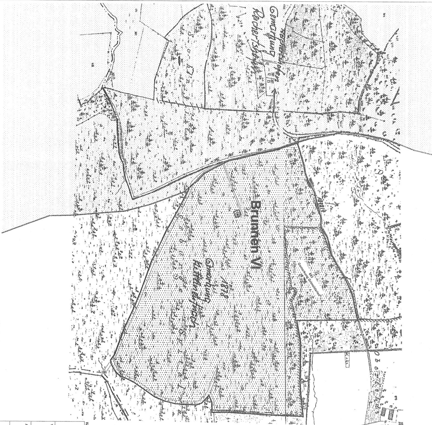
Planausschnitt Flurstück 1878/34 M. 1 : 500 verkleinert