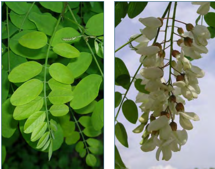
Abb. 5: Robinie

Die Robinie ist in den südlichen Appalachen Nordamerikas beheimatet und wurde zu Beginn des 17. Jahrhunderts in Mitteleuropa eingeführt. Sie ist eine wärme- und lichtliebende Baumart, die als Pionierpflanze die Wiederbewaldung offener Flächen einleitet. Ihre Samen werden durch Tiere verbreitet, außerdem kann sie durch Wurzeläusläufer in benachbarte Flächen einwandern. Auf Verletzung des Stammes reagiert die Pflanze mit Stockausschlag und verstärktem Wachstum. Die Robinie ist eine Leguminose und kann Luftstickstoff binden. So kann sie auch auf nährstoffarmen Standorten wachsen, z. B. Halbtrockenrasen. Der Stickstoff wird mit der Laubstreu und den abgestorbenen Wurzeln wieder an den Boden abgegeben.