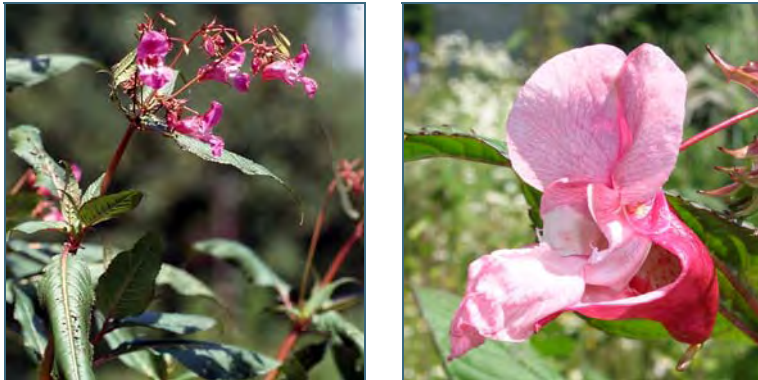
Abb. 1: Indisches Springkraut

bis Oktober. Die Blüten sind sehr reich an Nektar und werden von Hummeln und Bienen bestäubt. Eine einzige Pflanze produziert bis zu 4.000 Samen, die beim Aufplatzen der Samenkapsel bis zu 7 m weit geschleudert werden. Die Ausbreitung erfolgt ausschließlich durch Samen, die etwa sechs Jahre keimfähig bleiben.