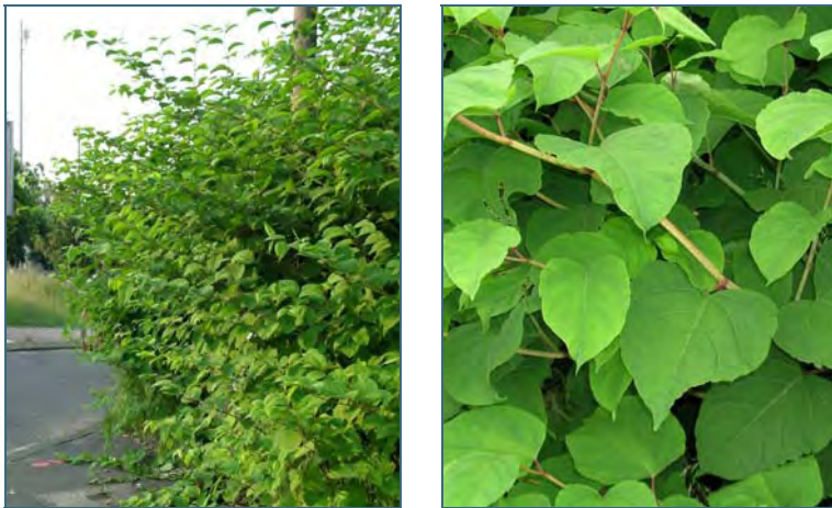
Abb. 2: Knöterich

Die Knötericharten breiten sich ausschließlich durch die Verschleppung von Wurzelstücken aus. Dies geschieht häufig mit Gartenabfällen oder mit Erdbewegungen. Auch entlang von Fließgewässern werden Wurzelstücke häufig verbreitet. In den 1950er Jahren wurden die Knötericharten von Jägern als Wildfutter angebaut, obwohl sie selbst im Jugendstadium nur wenig beäst werden. Da sie im Winter kahl werden, sind sie auch als Deckungspflanze für das Wild kaum geeignet.