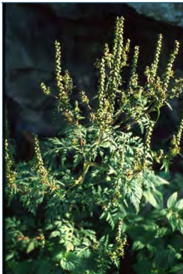
Abb. 8: Ambrosie

Von dort aus verbreitet sie sich v. a. entlang der Hauptverkehrsrouten. Die Samen haften an den Reifen der Autos und werden mit dem Fahrtwind verdriftet. Auch mit Mähreschern und als Verunreinigung in Saatgut oder Vogelfutter gelangt die Art in neue Wuchsgebiete.