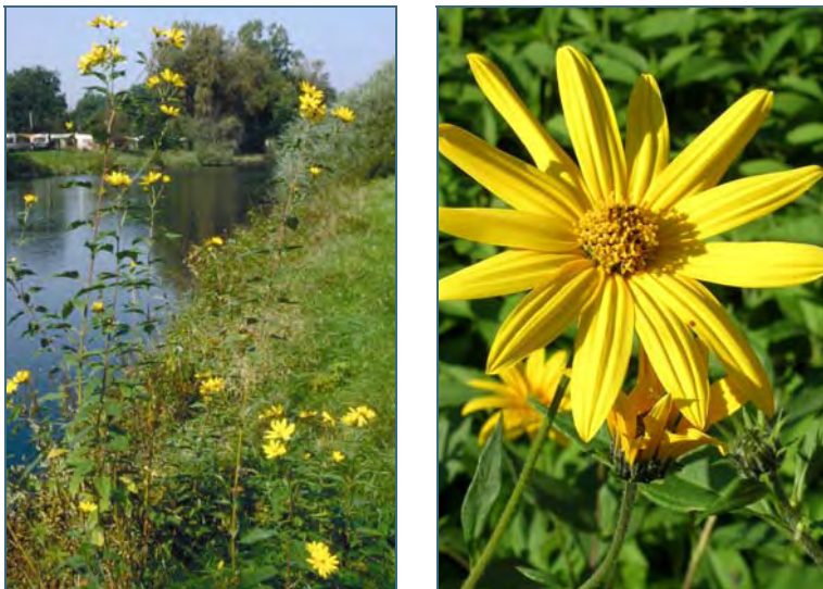
Abb. 7: Topinambur

Topinambur ist eine Lichtpflanze und meidet die Beschattung. Daher kann er sich unter einer Strauch- oder Baumschicht schwerer ansiedeln.