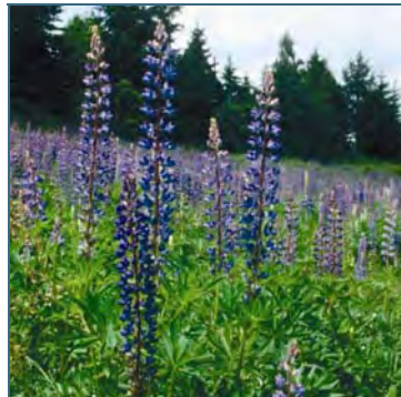
Abb. 6: Lupine

Bewertung: Die Stauden-Lupine trägt wie alle Leguminosen zu einer Nährstoffanreicherung des Standorts und damit zu seiner nachhaltigen Veränderung bei. Dadurch werden nährstoffliebende Arten gefördert, z.B. Brennnessel und Kletten-Labkraut. Durch die Beschattung verschwinden lichtliebende Arten der artenreichen Bergwiesen.