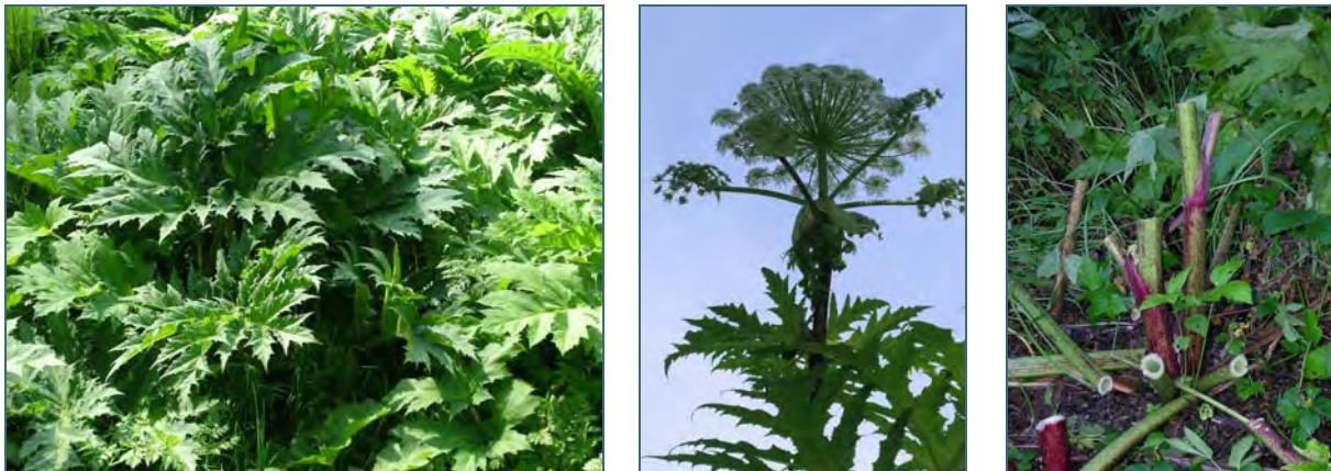
Abb. 4: Riesenbärenklau

Der Riesen-Bärenklau stammt aus dem Kaukasus und wurde im 19. Jahrhundert als Zierpflanze nach Mitteleuropa eingeführt. Er ist eine Lichtpflanze und besiedelt Acker- und Wiesenbrachen, Parkanlagen, Ruderalstellen und Wegränder. Er wird 3–4 m hoch und blüht erst im zweiten oder dritten Jahr. Dabei produziert eine Pflanze bis zu 50.000 gut schwimmfähige Samen. Nach der Blüte stirbt der Riesen-Bärenklau ab. Wird er vorher gemäht, treibt er wieder aus, bis er einmal zum Blühen kommt.